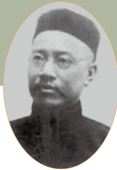
北京大学学長時代 (60歳) の嚴復 (啓蒙思想家、翻訳家 1854-1921年)