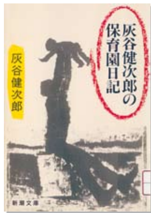
「灰谷健次郎の保育園日記」は、図書館2F「ブック村」コーナーに配架しています。