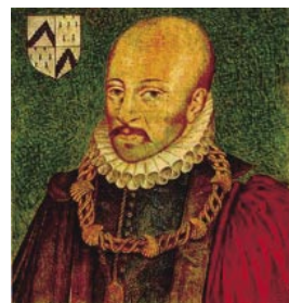
『エッセー』表紙とモンテーニュ肖像